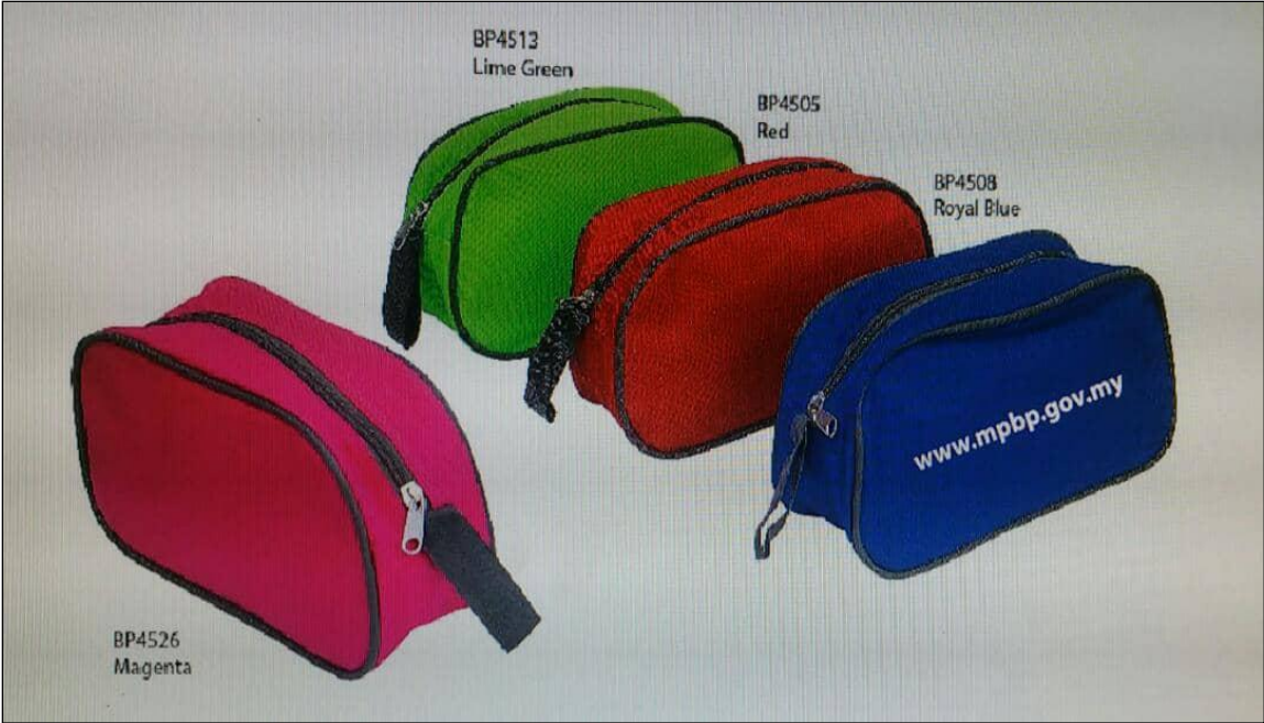
BP4513 Lime Green